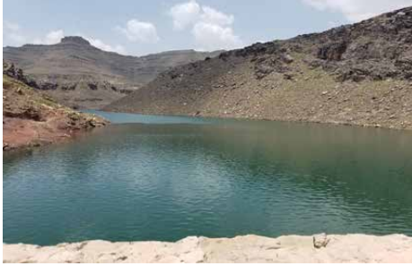
ينابيع عيون الماء قرية خيران

من العاصمة صنعاء، حيث تحتوي القرية على غيول، وعيون ماء كثيرة، يزيد ينابيعها خلال موسم الأمطار، وفيها العديد من الآبار اليدوية ذات الماء العذب، وتشتهر القرية بزراعة أجود أنواع العنب، وفيها سد رائع على شكل بحيرة ذات منظر خلاب، وبجانبه عيون ماء عذبة، ونظرا للتغيرات المناخية التي شهدتها اليمن مؤخرا، والتي أدت إلى زيادة سقوط الأمطار، ارتفع زوار هذه القرية خلال السنوات الأخيرة.