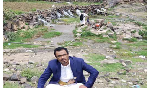
سد قرية خيران

والى جانب قرىتي حيفتين وخيران تأتي قرية بيت رزيق كمنطقة سياحية هامة، وتقع في مديرية بني حشيش التابعة لمحافظة صنعاء وتبعد عنها مسافة ساعة لمن يقصدها راكبا السيارة، ولعل أهم معالم القرية السياحية وجود بركة ماء كبيرة بين الصخور، وبجوار جبل، حيث يمارس الشباب رياضة القفز من فوق قمة الجبل إلى قاع البركة للسباحة، بأجواء تملؤها الإثارة، كما يوجد بالقرية حقول العنب ذات الأنواع المتعددة، والمحاصيل الأخرى من الفواكه والخضار والبقوليات، حيث يمكن للزوار التعرف على أصناف العنب، والتجوال دخل الحقول بحرية، وتناول عناقيد العنب وسط ترحيب من المزارعين، كما يمكنهم شراء منتجاتهم من فواكه وخضروات مباشرة من المزارع، وعلى قرب مسافة قصيرة من القرية، توجد قرية بيت السيد المشهورة بصناعة الفخار المحلي، حيث يتم صناعة الأواني المنزلية القديمة، وهناك يتعرف الزوار على هذه الحرفة اليدوية والتقليدية، ويمكنهم شراء الفخاريات بأسعار رخيصة، مقارنة بما هو عليه الحال في المدينة.