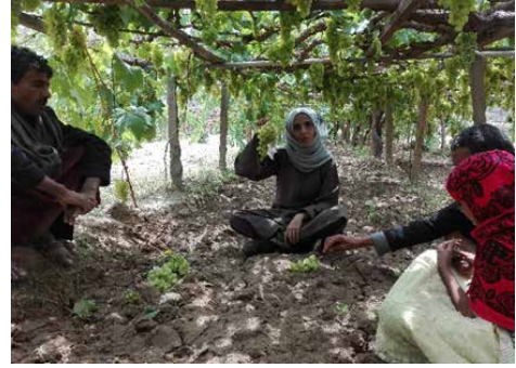
التجوال دخل حقول العنب مع الأهالي / قرية بيت ريق جزء من بركة الماء / قرية بيت رزيق

ومن ضمن القرى السياحية المحيطة بالعاصمة صنعاء قرية المحجر، التي تقع بمديرية شبام كوكبان التابعة لمحافظة المحويت، وتبعد عن العاصمة صنعاء حوالي 56 كيلو متر، وهي قرية عجيبة، تمتلك مجموعة من الكهوف المغمورة بالماء العذب، النابع من سطح الأرض، بالإضافة إلى حقول البن والمحاصيل الزراعية الأخرى.